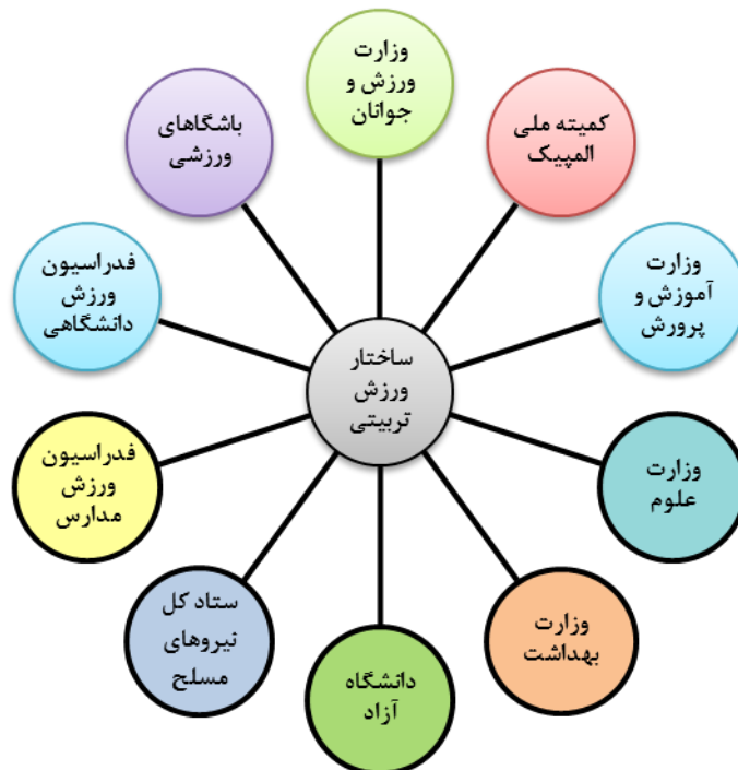
شکل ۲- سازمان‌ها و دستگاه‌های دخیل در مدیریت ورزش تربیتی ایران