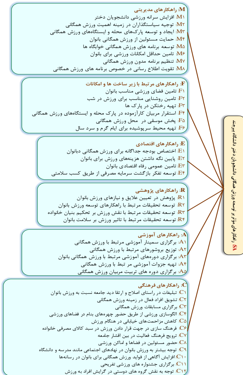
شکل ۱- راهکارهای توسعه ورزش همگانی دانشجویان دختر دانشگاه بیرجند