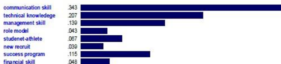
شکل ۲- نمودار مستخرج از مقایسه‌های زوجی مؤلفه‌ها از طریق نرم‌افزار اکسپرت چویس

با توجه به استفاده از روش ای.اچ.پی. برای اولویت‌بندی مؤلفه‌ها در شکل زیر نمودار مستخرج از نرم‌افزار اکسپرت چویس مشاهده می‌شود.