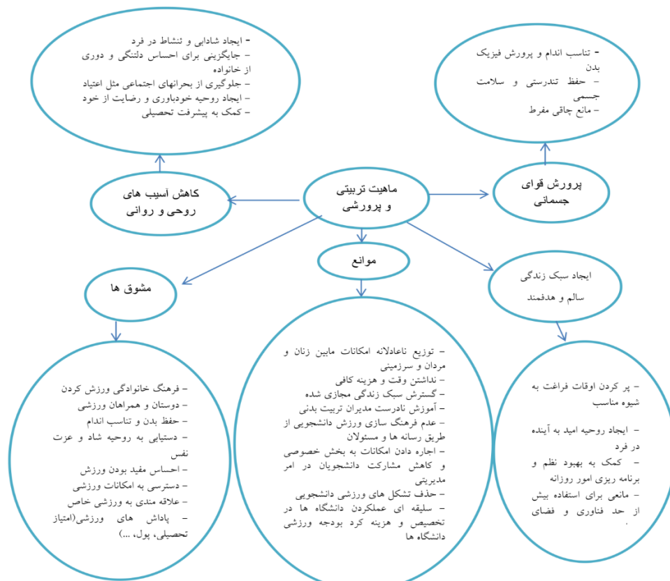
شکل شماره (۱) - شبکه مضامین مرتبط با چیستی ورزش دانشجویی

نخستین مضمون فراگیر که مرکز ثقل تمامی مصاحبه‌ها و مورد تأکید تمامی نمونه‌ها بوده است ماهیت تعلیمی و تربیتی ورزش دانشجویی در ایران است که حول سه مضمون پرورش قوای جسمانی، ایجاد سبک زندگی سالم و هدفمند و کاهش آسیب‌های روحی و روانی بیان شده است. مضمون فراگیر دیگری که در اکثر مصاحبه‌ها بر آن تأکید می‌شد توجه به موانع و ذکر مشوق‌هایی است که می‌تواند منجر به توسعه و گسترش و فرهنگ‌سازی ورزش دانشجویی در سطح کشور شود. بنابراین نتایج به‌دست آمده از مضامین فوق را می‌توان به صورت شبکه مضامین مرتبط با چیستی ورزش دانشجویی به صورت ذیل ارائه کرد: