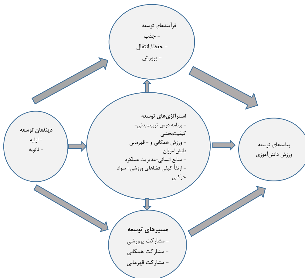
شکل ۱- مدل مفهومی پژوهش

حوزه ورزش دانش آموزی است. چارچوب مفهومی انتخاب شده برای مدلسازی در این پژوهش براساس مطالعه نظری (کتابخانه‌ای و اسنادی) و با توجه به وضعیت فعلی ورزش دانش‌آموزی و با در نظر گرفتن مشکلات و چالش‌ها و متناسب با اهداف عالی تعلیم و تربیت و اسناد بالا دستی (سند چشم‌انداز ۱۴۰۴، سند تحول بنیادین آموزش و پرورش، برنامه ملی درسی، و برنامه ششم توسعه) و مطالعه تجربی (مصاحبه) تدوین شده است و شامل پنج منظر اصلی؛ ذینفعان، استراتژی‌ها، فرایندها، مسیرها و پیامدهای توسعه ورزش در حوزه ورزش دانش‌آموزی است. مدل نظری شناسایی شده (شکل ۱) توسط صاحب‌نظران و از طریق پرسش‌نامه مورد ادراک قرار گرفت و به صورت مدل معادلات ساختاری (شکل ۲) تبیین و تأیید شد.