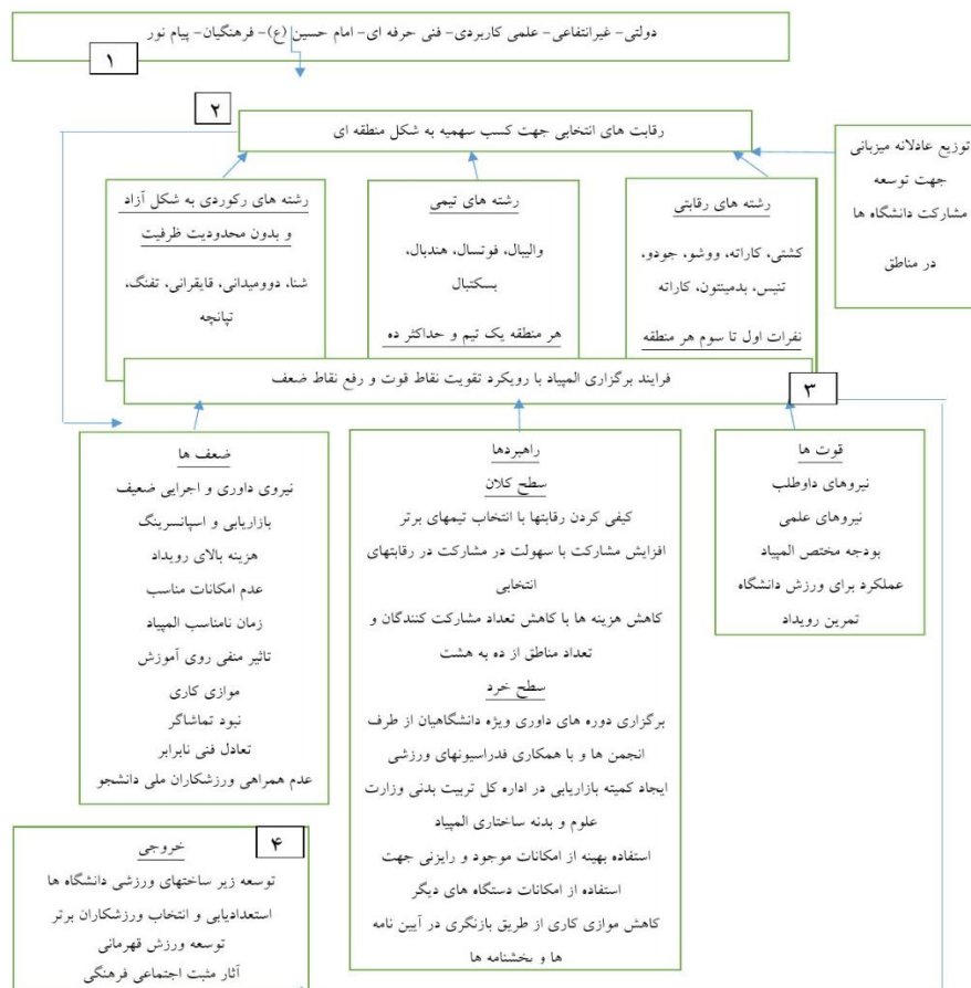
شکل ۲. مدل کاربردی برگزاری المپیاد ورزشی دانشجویان