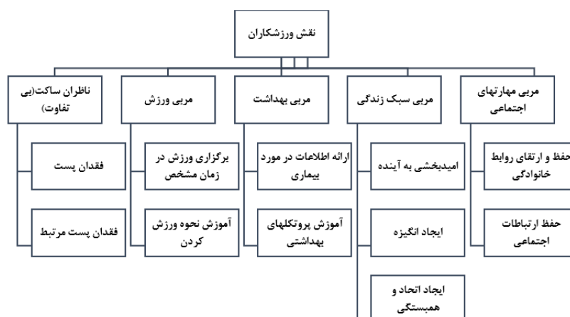
شکل ۱- نقشه تماتیک سلسله مراتبی نقش‌های تربیتی ورزشکاران در عالم گیری کرونا در اینستاگرام

به همین دلیل، ورزشکاران مشهور و نخبه در دوران عالم گیری، نقش‌های مختلفی را در شبکه اینستاگرام بر عهده داشتند. در ادامه هر نقش و زیرمجموعه‌های آن در قالب تحلیل ولکات به صورت تفسیر لایه‌ای الگوی تماتیک (شکل ۱) تحلیل می‌شوند و برای این امر از روش تحلیل تفسیری استفاده شده است.