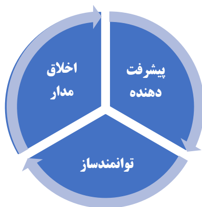
شکل ۱- نقش‌های مربیان در ارشادگری ورزشکاران