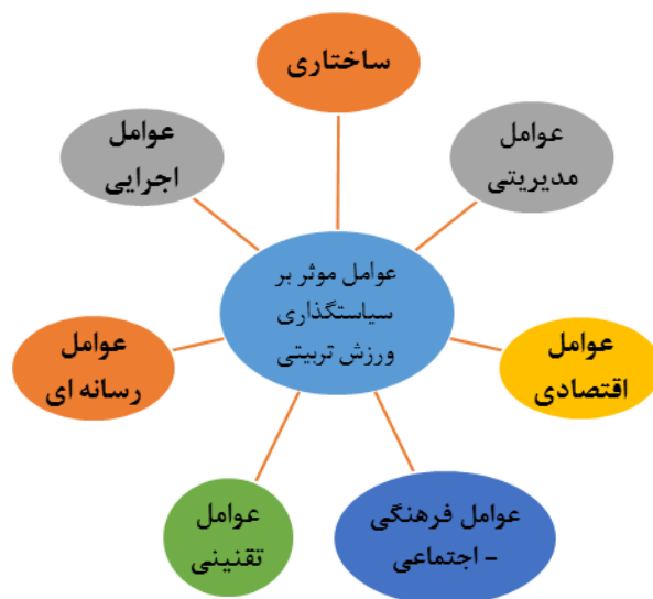
شکل ۲- عوامل اثرگذار بر وضعیت سیاست‌گذاری در ورزش تربیتی افراد دارای معلولیت