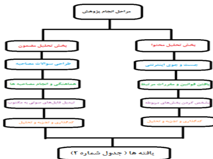
شکل ۱- مراحل انجام پژوهش